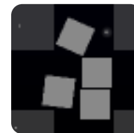
障害物 触れると壊れる.