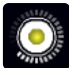
スイッチ(OFF) スイッチ(ON) 同じマークがついた仕掛けを動かす.