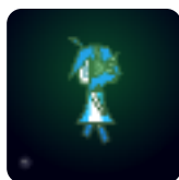
テック(1P) テック(2P) プレイヤーキャラクター.