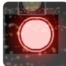
ゴール テック全員が触れるとクリア.